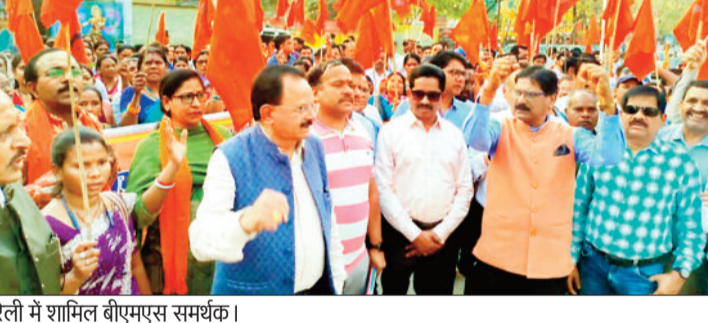
रैली में शामिल बीएमएस समर्थक।