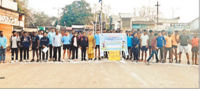
मैराथन दौड़ में शामिल युवा।

पामगढ़ ब्लॉक में युवाओं द्वारा समाज को सकारात्मक एवं प्रेरक संदेश देने के उद्देश्य से युवा मैराथन का उत्साहपूर्ण आयोजन किया गया। प्रातः आयोजित