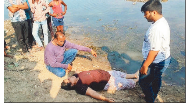
शव के पास विलाप करते परिजन।

हसदेव नदी स्थित बाबा डेराघाट पर स्कूटी से पहुंची एक महिला वहां रूककर पहले मोबाइल फोन पर किसी से बात की, इसके बाद अचानक बहती नदी में छलांग लगा दी। पुलिस के साथ आसपास के लोगों की मदद से उसकी तलाश की गई और कुछ देर बाद उसके शव को बाहर निकाला गया। पुलिस मर्ग कायम कर मामले की जांच कर रही है।